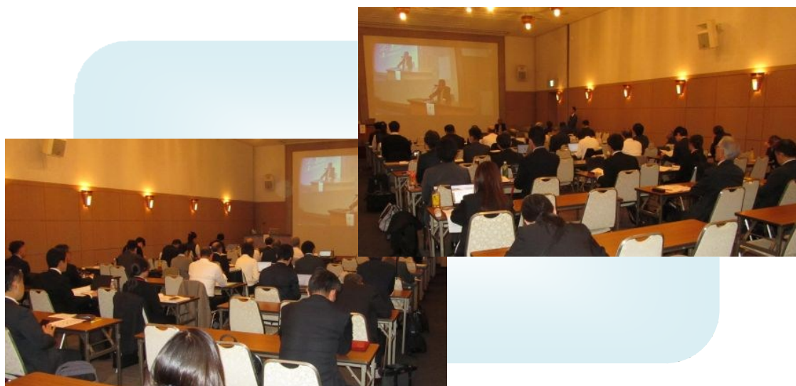
講演会場の様子(参加者数:会場 約 40 名、オンライン 約 40 名)