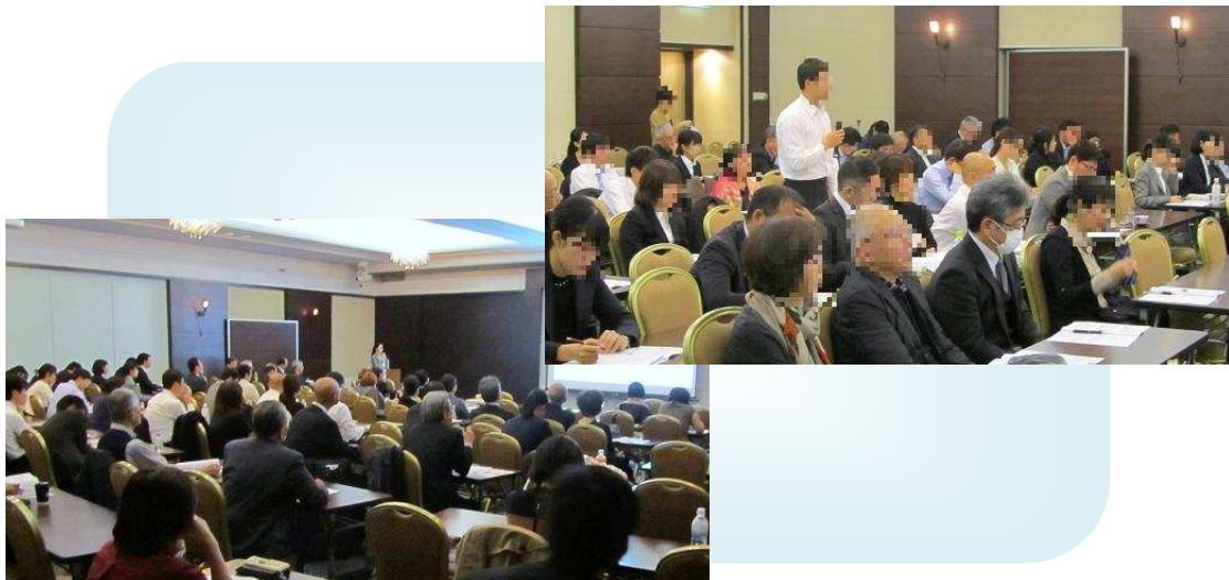
講演・質疑応答の様子